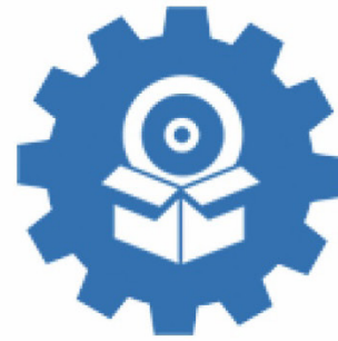
Lizenz- und Supportverträge bei Software-Herstellern