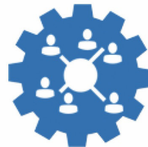
Service- und Maintenance-Agreements bei Telekommunikationsunternehmen und Netzwerkherstellern